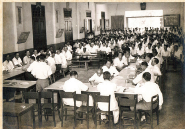
1961年〈四維堂〉反改制大會，決定中化中學的命運