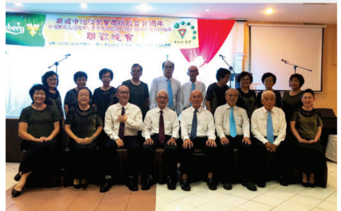
麻坡中化校友会顾问与合唱团合影