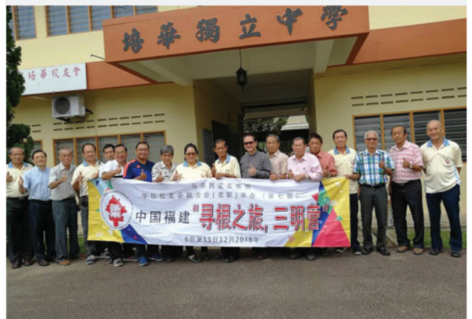
柔華校友聯于利丰港培華獨中召開 第七屆中國福建省三明市冬令營講解會 (6至15-12-2018)