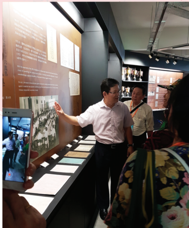
探訪團參觀中化中學校史館

另外在勿洞，也受到勿洞華僑華人的熱情招待，他們送來榴槿、山竹、紅毛丹這些在香港那麼稀有、珍貴的熱帶水果，卻讓團員任吃、任拿帶走，真是不可思議！