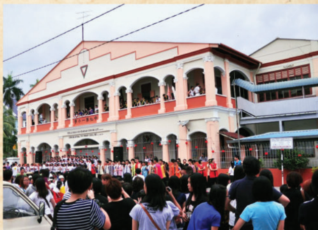
2012年中化中學歡慶百年校庆，學生遊行至〈四維堂〉前