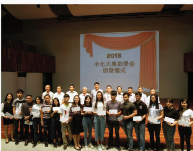
2018中化中学大专助学金颁奖礼得奖者合影 (9-8-2018)