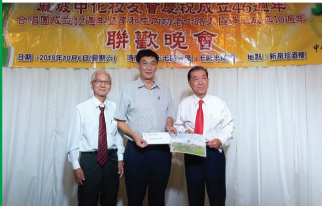
移交报效金予中化中学