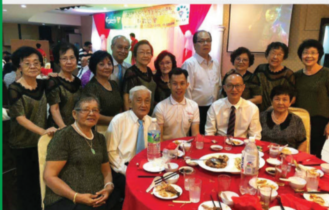
联欢晚宴合唱团团员喜相聚