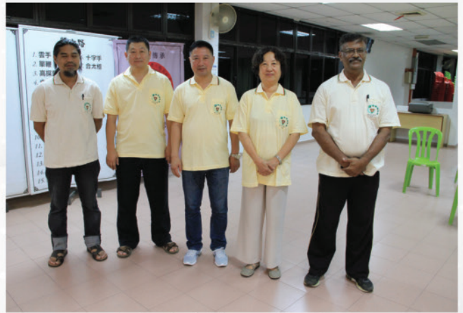
友族同胞学员与三位导师留影