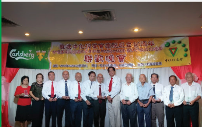
颁发十年以上本会理事长期服务奖