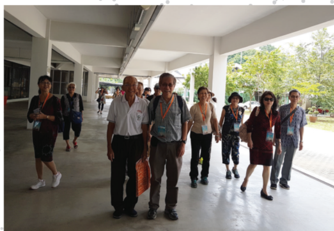
探訪團參觀中化中學圖書館