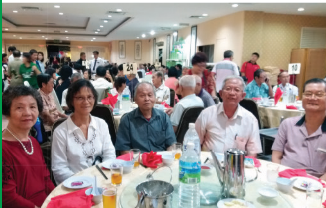
联欢晚宴校友们相聚一堂话当年