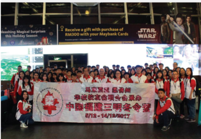
第六屆中國福建省三明市冬令營 承辦單位柔華校友聯理事與營員合影 (5至14-12-2017)