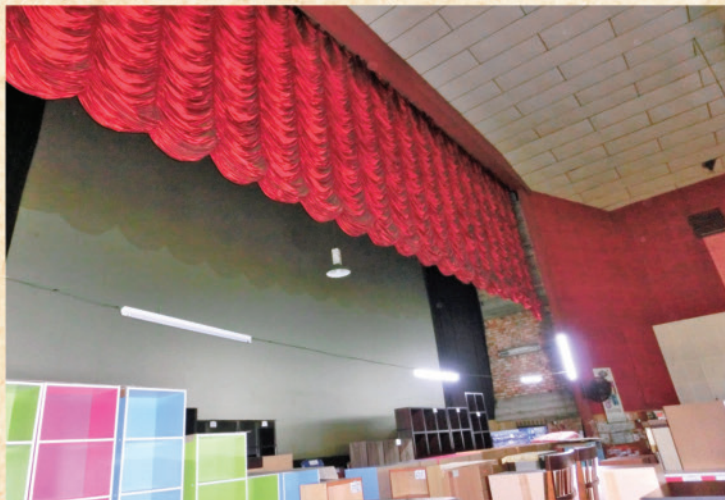
當今〈新民舞台〉內堆放電器店的貨品。