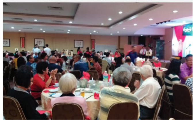
联欢晚宴热闹现场