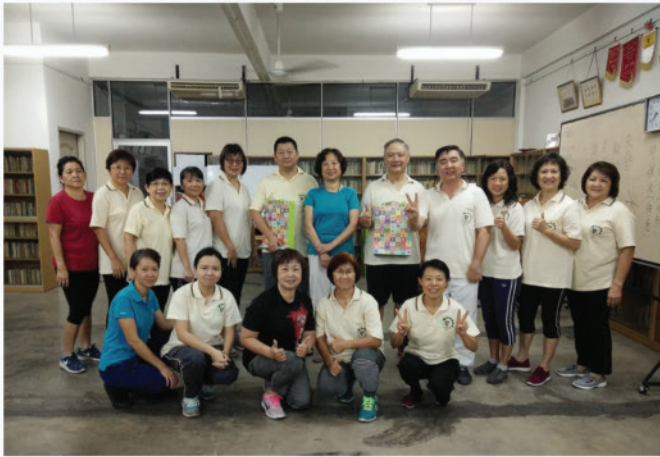
学员与导师们合照留念