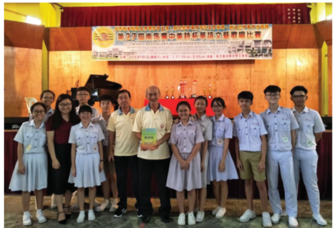
第27屆南馬獨中美詩杯華語文藝歌唱比賽 中化中學代表參賽團與校友會理事合影 (1-9-2018)