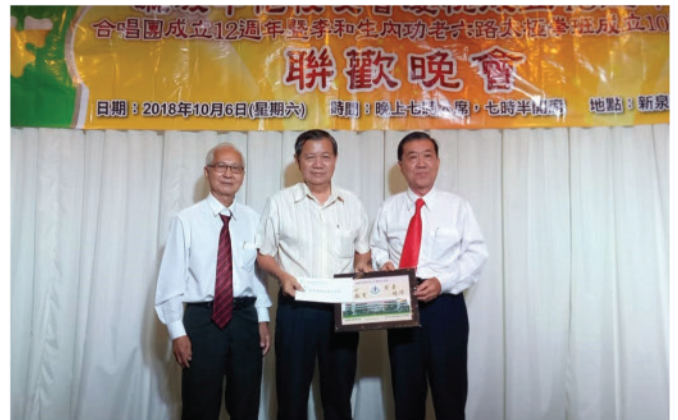
移交报效金予利丰港培华独中