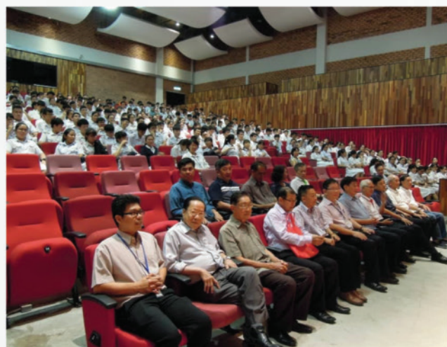
2018中化中学大专助学金颁奖礼现场 哥伦亚友演艺厅 (9-8-2018)