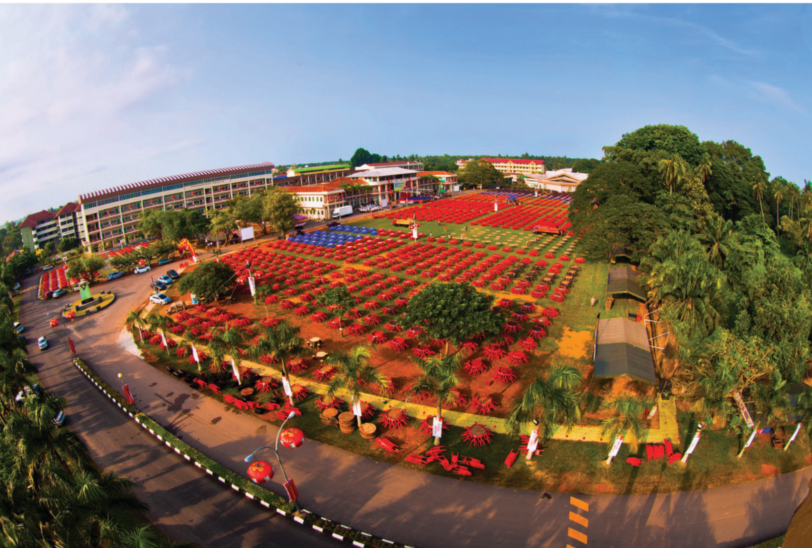
中化中學百年校庆鳥瞰圖