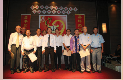
全体顾问与主席合影