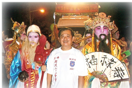
作者（中）摄于新山古庙游神

前人植树，后人纳凉，期望马来西亚的华文独立中学能够一代传一代地维持下去，流芳百世。