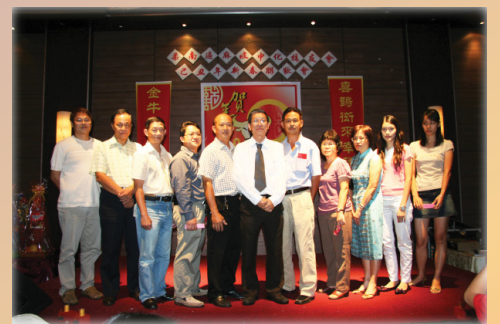
“新鲜人”：新入会校友与主席合影