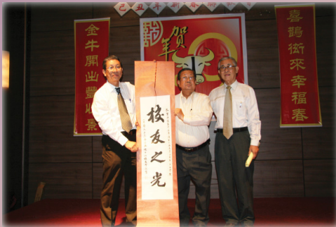
马议（红莲蕃）学长荣获马华文学奖，获本会表扬。